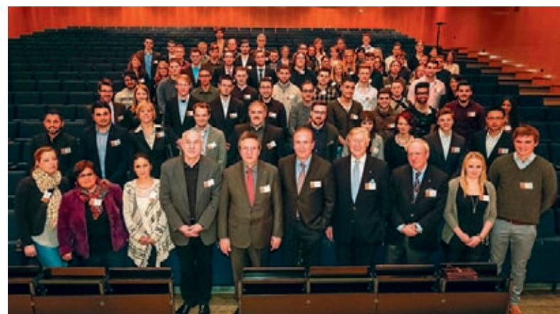
Es werden immer mehr: Stifter und Studierende bei der Stipendiatenfeier.

„Beide Programme gehen Hand in Hand. Die Scouts spüren die Talente auf, die dann im TalentKolleg zielgerichtet unterstützt werden können. Zum Beispiel bei der Orientierung, welches der richtige Bildungsweg für sie ist oder wie man sich am besten für einen erfolgreichen Studienabschluss qualifiziert“, erklärt Svenja Schulze, Ministerin für Innovation, Wissenschaft und Forschung NRW.