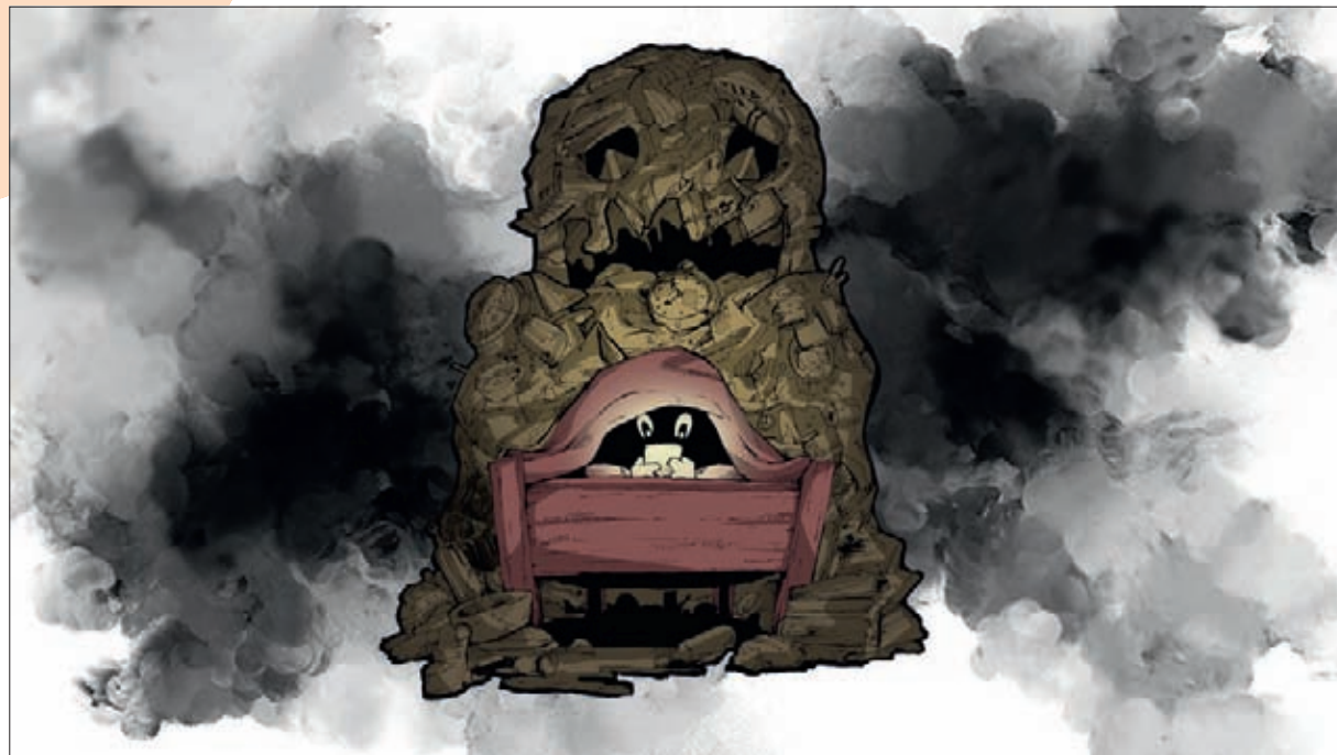
Illustration: Nils Degenhardt

Setzt dem inneren Schweinehund einen Maulkorb auf! Wir drücken dir für die Lernphasen und Prüfungen die Daumen und wünschen euch Motivation und Durchhaltevermögen ohne Ende!