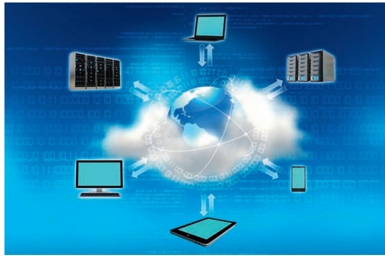
Der neue Cloud-Dienst „Sciebo“ ermöglicht die Synchronisation von Daten mit verschiedenen Endgeräten.

Bei den meisten kommerziellen Cloud-Speicherdiensten wie Dropbox, iCloud, SkyDrive oder Google Drive liegen die Daten auf Servern im Ausland. Damit verbunden sind häufig laxere Datenschutzvorschriften und un-