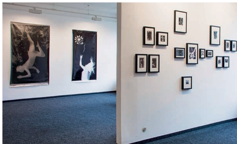
Die Ausstellung Licht Körper in der Galerie des Fachbereichs Design.

Weiterhin sollten sie das uralte Prinzip der Lochkamera – ein lichtdichter Kasten mit einem winzigen Loch – modern interpretieren. Zum Beispiel nahmen sie mit diesem extrem langsamen Aufnahmeverfahren Bilder aus einem fahrenden Auto heraus auf oder experimentierten mit Doppelbelichtungen. Und was hat den Studierenden am besten an dem Projekt gefallen? „Der Moment in der Dunkelkammer, als wir alle gespannt vor dem Entwicklungsbecken standen und beobachteten, wie die ersten Konturen des Bildes vor unseren